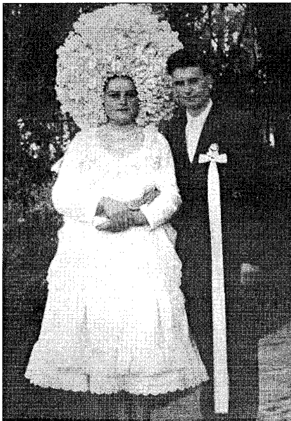
Парадни портрет тек венчаних

ваним песмама, враголанкама. Једна од њих гласи: "Кокош ова пре свог смака/ по дворитишту кокодака/ ал' одавно жива није/ нск се једе, нек се пије!! Обрните унис ноге/ да б' у лонац стати могле/ да би масна била супа/ куварница коку очерупа/ резанци јој друштво праве/ свато-