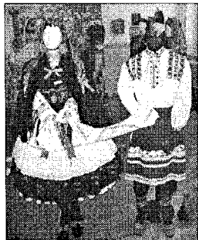
Ношња за свечарске прилике

вачкој успели да сачувамо ни део оваквог културног блага, као наша браћа у Доњој земљи". Велина од двеста експоната - народне ношње, девојачка спрема, старе увеличане фотографије - генерацијама је чувана по кућама Словака из Ердевића, Ковачице, Пивница,