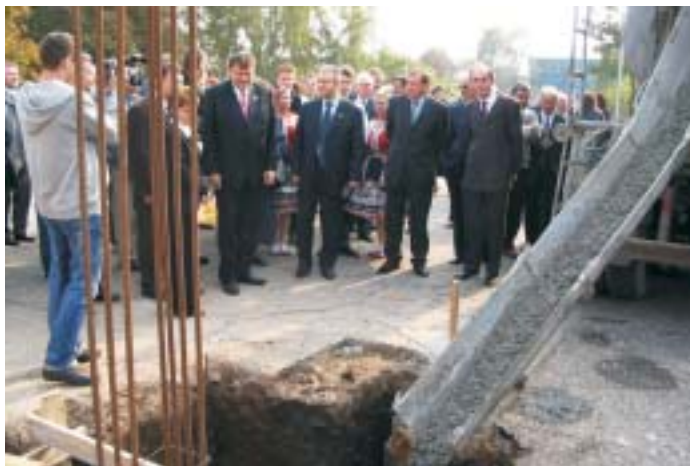
Tu vyrastie nová časť budovy PU Včielka