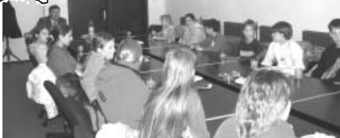
Baby Ježibaby na prijatí u predsedu obce