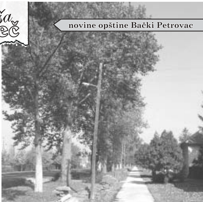
Doprajme život týmto platanom