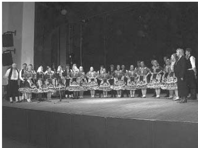
Petrovskí spolkári všade oduševnili divákov