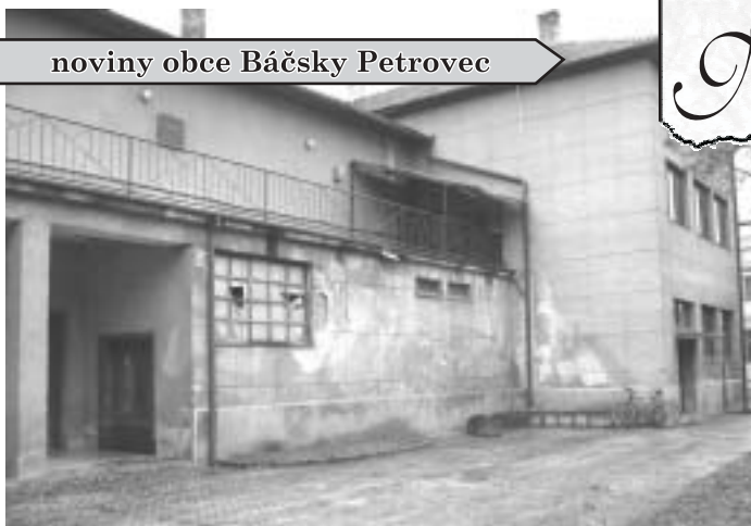
Aj budova SVD súrne potrebuje úpravu